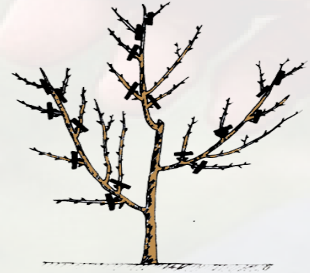
8 - زبيرة الشتاء (سنة خامسة)

وفي الشتاء الموالي يقع قص كل الأغصان التي وقع تحبيسها في الصيف على مستوى برعمين وتنظيف أعلى الفروع الرئيسية على طول 20 إلى 25 سم (صورة 8).