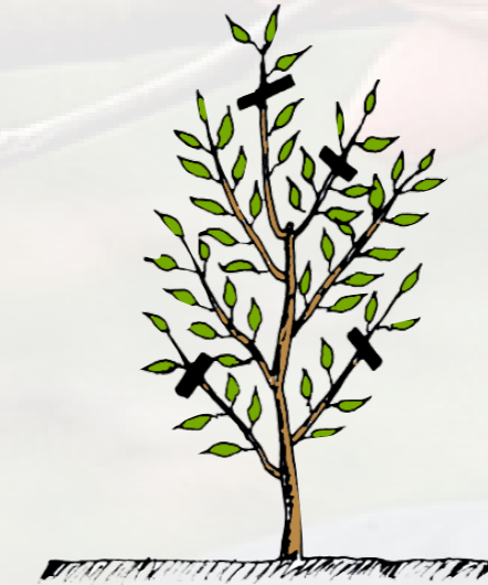
2 - زبيرة الصيف ( سنة أولى )

في شهر نوفمبر - ديسمبر يقع قص كل الأغصان التي وقع تحبيسها سابقا على برعمين ويحتفظ بالثلاثة أو الأربعة أغصان التي وقع إختيارها في الصيف الذي سبق، كما ينظف أعلى الفرع الرئيسي (الجباد) على طول 20 إلى 30 سم (صورة 5).