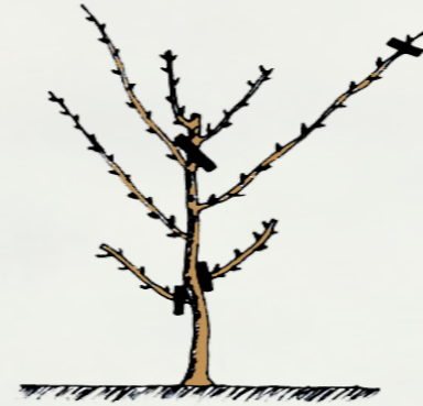
3 - زبيرة الشتاء ( سنة ثانية )

في الشتاء يقع قص كل الأغصان التي وقع تحبيسها سابقا على برعمين والإحتفاظ بالأغصان الأخرى التي وقع إختيارها سلفا، كما يقع تنظيف أعلى الأغصان (الجباد) على طول 20 إلى 30 سم (صورة 7) وفي الصيف يقع إختيار غصنين في إتجاهين متعاكسين على كل فرع هيكلي يكون الأسفل منها في إتجاه الغصن الأسفل الذي وقع إختياره سابقا وتحبيس باقي الأغصان الأخرى.