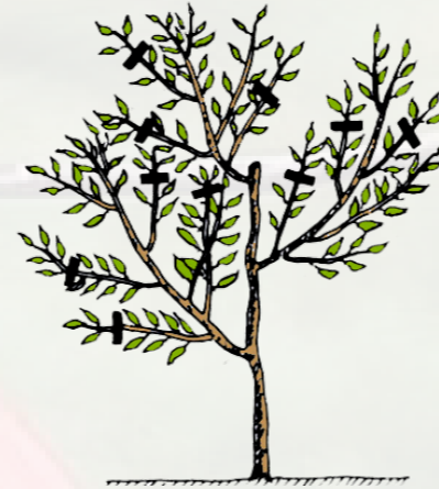
4 - زبيرة الصيف ( سنة ثانية )

في شهر جوان أو جويلية يقع إختيار غصن على كل واحد من الثلاثة أو الأربعة فروع الهيكلية (الأعتاق)، تكون هذه الأغصان لها نفس الإتجاه وعلى بعد 25 إلى 30 سم من الجذع ولا تكون في إتجاه عمودي، ويقع تحبيس كل الأغصان الأخرى التي يفوق طولها 25 سم (صورة 4).