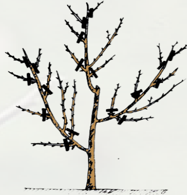
5 - زبيرة الشتاء ( سنة ثالثة )

في شهر جوان أو جويلية يقع إختيار 3 أو 4 أغصان التي سنكون الهيكل الأساسي للشجرة (الأعتاق) والتي يجب أن تكون ظاهرة من نفس المكان أو لها نفس الإتجاه، ويقع تحبيس كل الأغصان الأخرى التي يفوق طولها 25 سم (صورة 2).