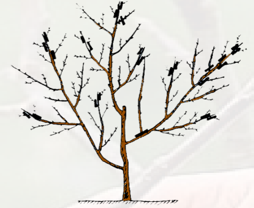
7 - زبيرة الشتاء (سنة رابعة)

وفي الشتاء الموالي يقع قص كل الأغصان التي وقع تحبيسها في الصيف على مستوى برعمين وتنظيف أعلى الفروع الرئيسية على طول 20 إلى 25 سم (صورة 8).