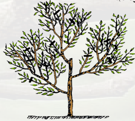
6 - زبيرة الصيف ( سنة ثالثة )

في الصيف يقع إختيار غصن ثان على كل فرع رئيسي يكون ظاهرا في إتجاه معاكس للغصن الأول وبعيد عنه بحوالي 25 سم، كما يقع تحبيس كل الأغصان الأخرى التي طولها 25 سم، (صورة 6).