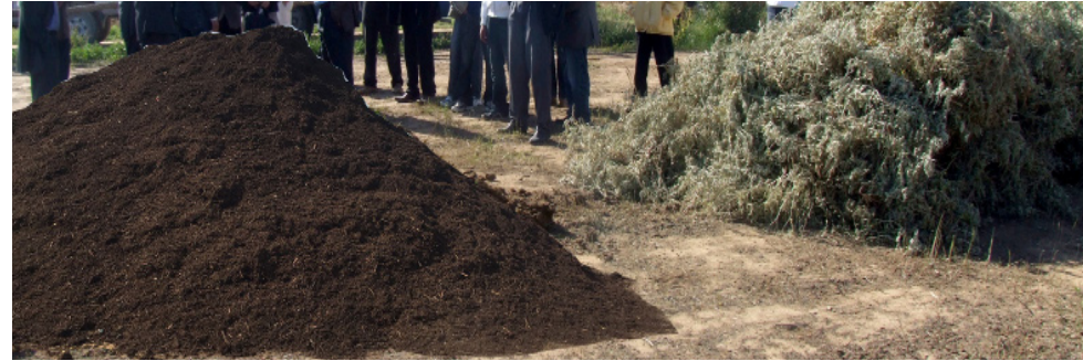
إستغلال نبتة الشويكة لتحضير الكومبست

■ استخدام بقايا أجزاء النبتة في تحضير السماد العضوي المتحلل عن طريق الكمبوستاج.