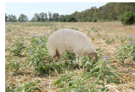
إنتشار نبتة الشويكة عن طريق الحيوانات

يمكن للنبتة الواحدة أن تنتج العديد من الثمار وتحتوي كل ثمرة على 150 بذرة قادرة على الإنبات.