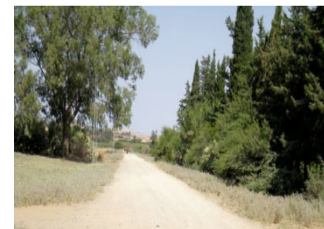
تلوث جوانب المسالك الفلاحية بنبتة الشويكة