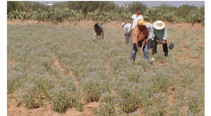
التقلع اليدوي لنبتة الشويكة