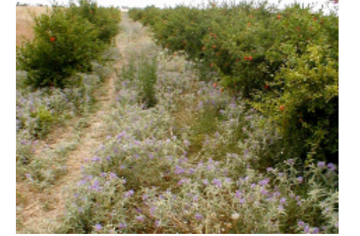
إكتساح نبتة الشويكة للأراضي ومنافسيتها للمزروعات

الأشواك والزعغات على السيقان والأوراق تجعل الحيوانات العاشبة تنفر منها وهذا ما يفسر انتشارها بكثرة في المراعي.